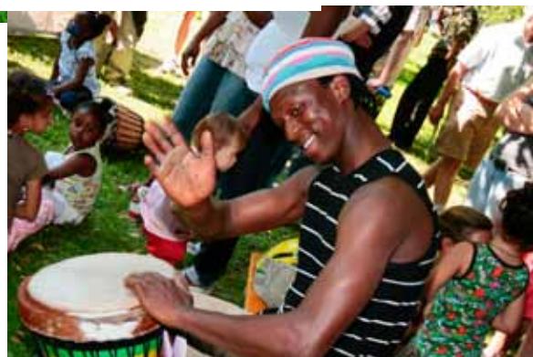
Trommel – Workshop für AnfängerInnen und Fortgeschrittene mit dem Meistertrommler Sidi Keita / Senegal